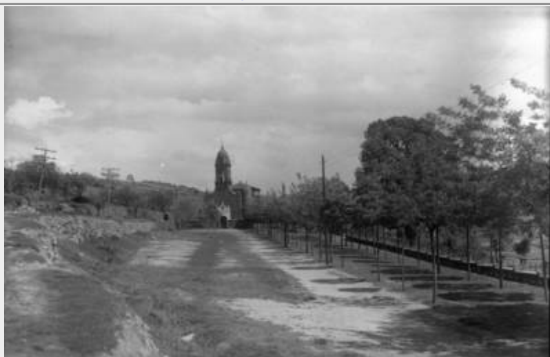
Santuario del Ecce Homo