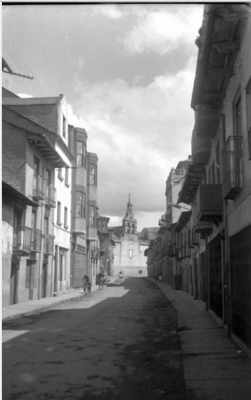
Calle Escobar con Iglesia de San Pedro al fondo