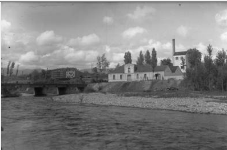
Río Boeza, con el puente y la fábrica de alcohol