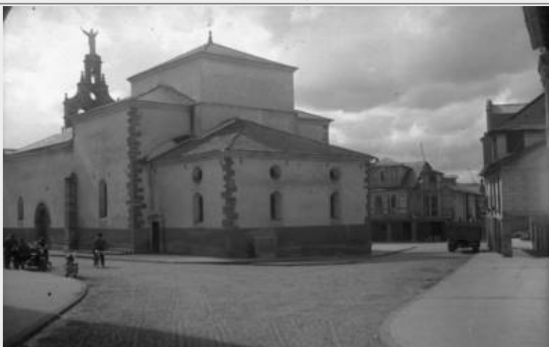
iglesia de San Pedro Apóstol