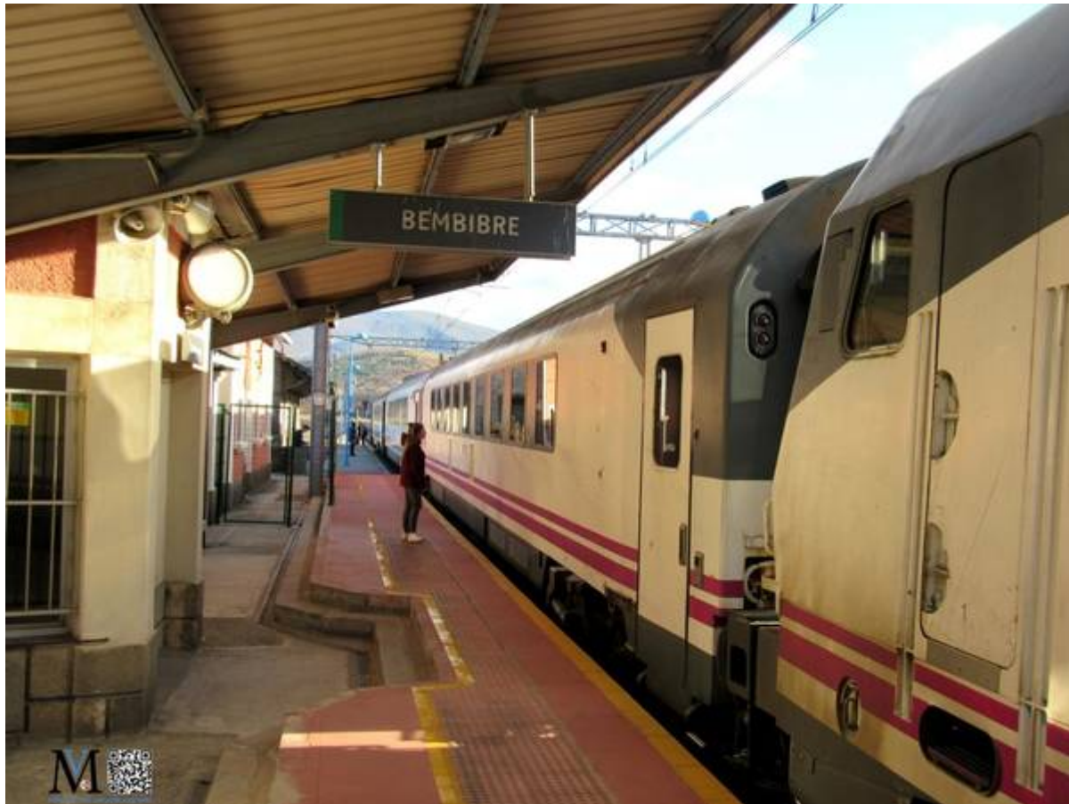
Estación de ferrocarril 2017