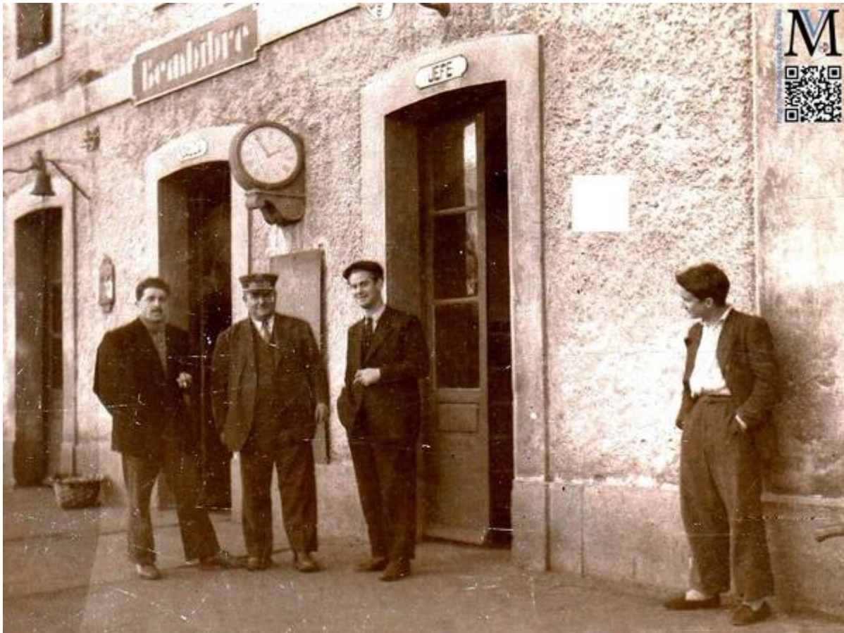
Estación de ferrocarril 1948