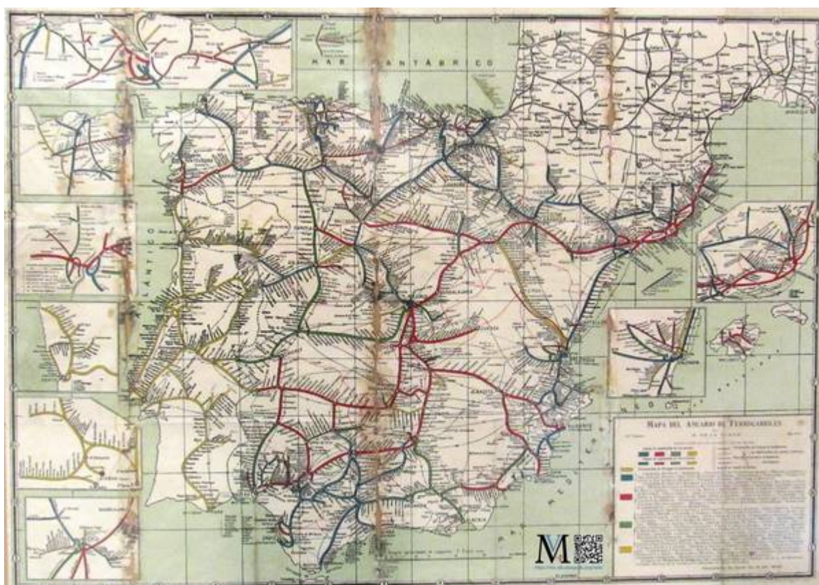
Mapa de líneas de ferrocarril 1914